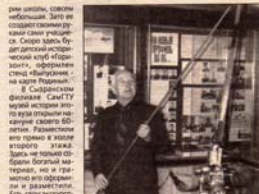
Музей Сызранского завода, посвященный истории сызранского завода.

В рамках программы «Связь поколений» в Сызранском районе реализуется проект «Связь поколений», который ставит перед собой задачу повышения уровня культуры и образования молодежи.