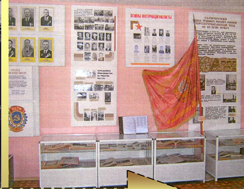
Работа музея с 1981 г по настоящее время...